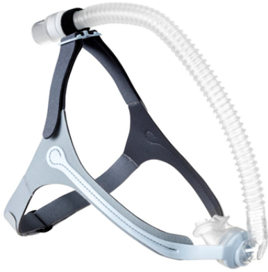
Respireo Primo P