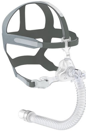
Respireo SOFT Child